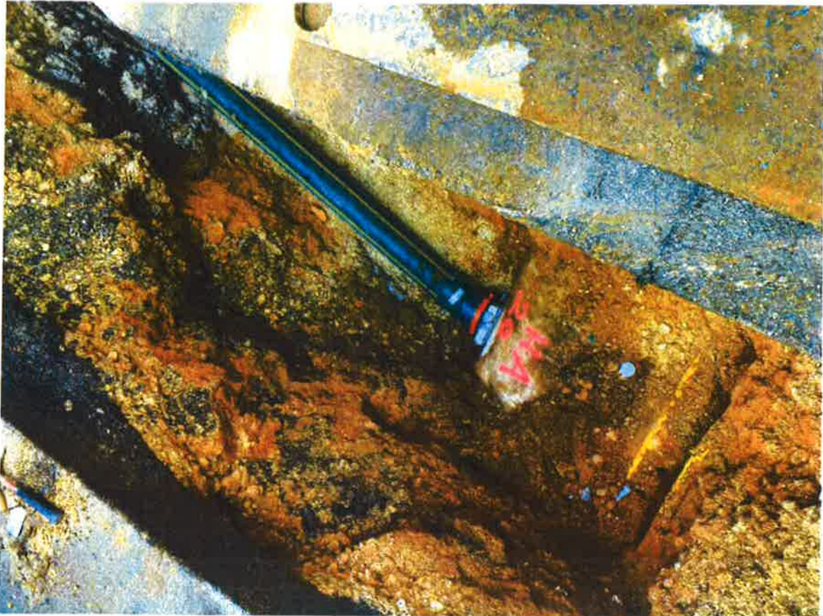
Detail Herstellung neuer Hausanschluss an Hauptkanal

Im Anschluss an die Kanalsanierung in der Graf-Karl-Straße erfolgt der Ausbau der Bauhofstraße.