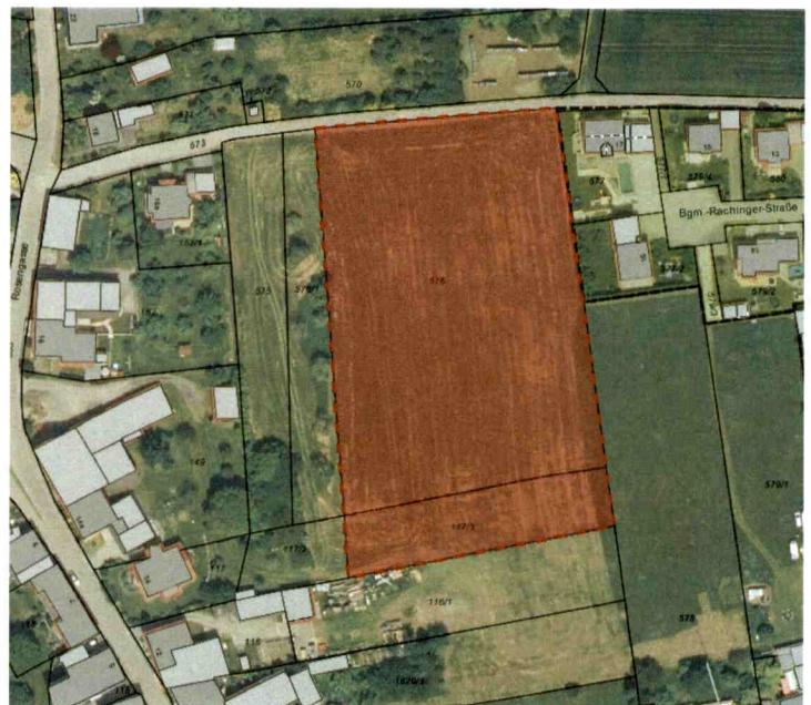
Lageplan mit Flächenumgriff des Geltungsbereichs

Es sollen gem. § 4 BauNVO ein Allgemeines Wohngebiet sowie Verkehrsflächen festgesetzt werden.