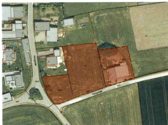
Lageplan mit Flächenumgriff des Geltungsbereichs

Der Entwurf der Einbeziehungssatzung „Hutgasse“ im Ortsteil Bieswang, bestehend aus Planblatt, Satzung und Begründung in der Fassung vom 19.10.2023 sowie die nach Einschätzung der Gemeinde wesentlichen, bereits vorliegenden umweltbezogenen Stellungnahmen werden gemäß § 3 Abs. 2 BauGB in der Zeit