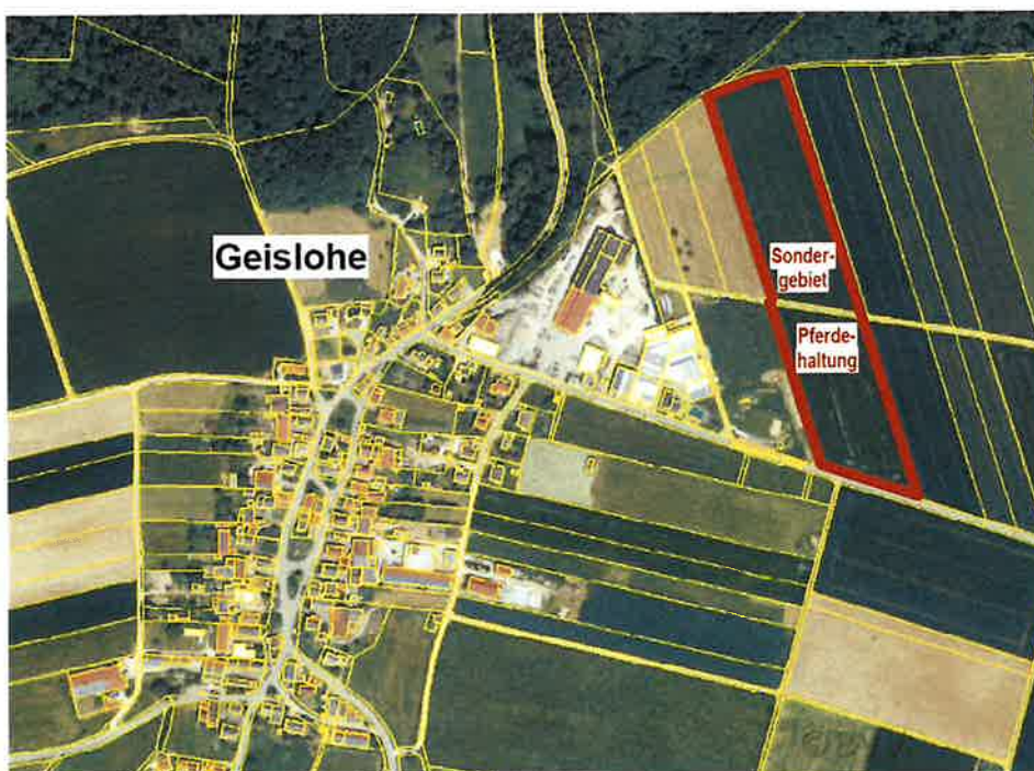
Luftbild Ortsteil Geislohe, Stadt Pappenheim Auszug aus BayernAtlas

Mit der Erarbeitung des Planentwurfes wurde das Ingenieurbüro für Tiefbau GmbH VNI , Nordring 4, 91757 Pleinfeld beauftragt.