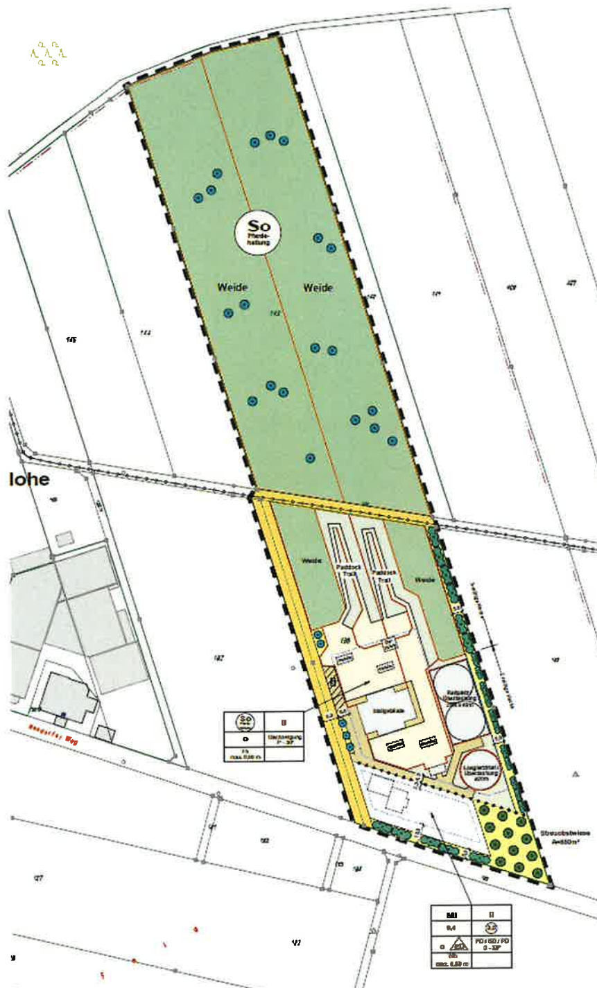
Flächenumgriff und Vorentwurf