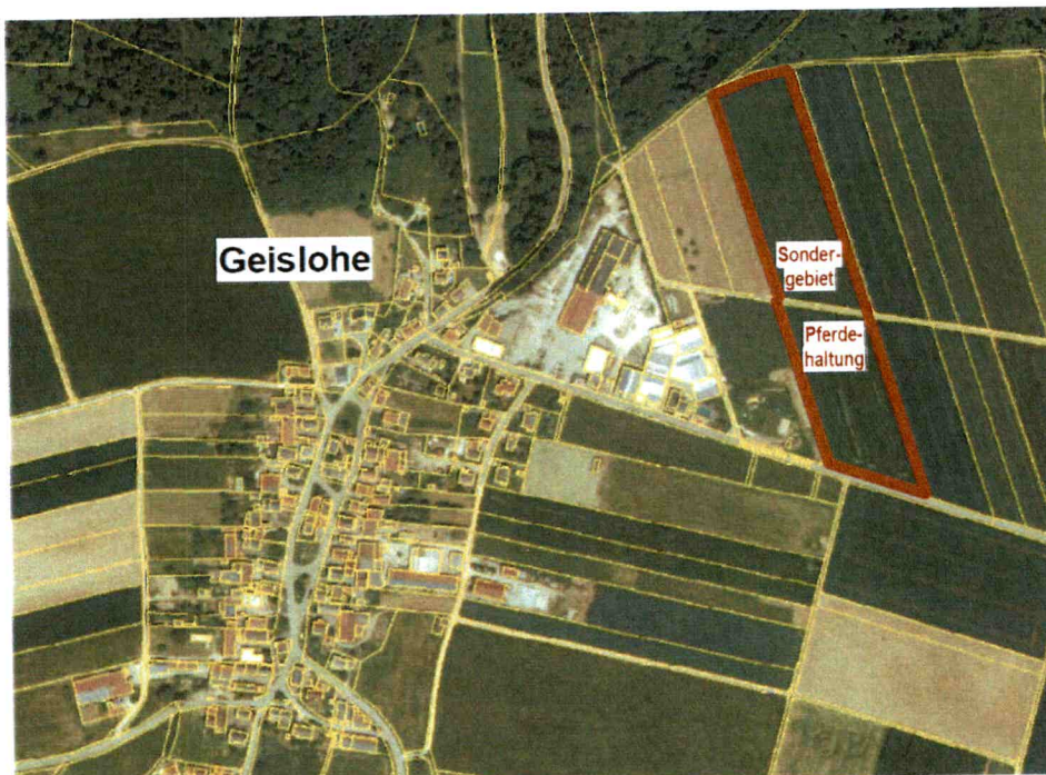
Luftbild Ortsteil Geislohe, Stadt Pappenheim Auszug aus BayernAtlas

Die Lage und der Flächenumgriff sind dem untenstehenden Lageplan zu entnehmen.