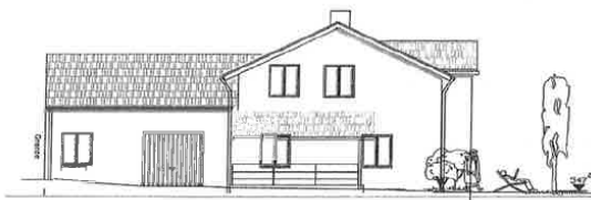
Ansicht West von Kreisstraße